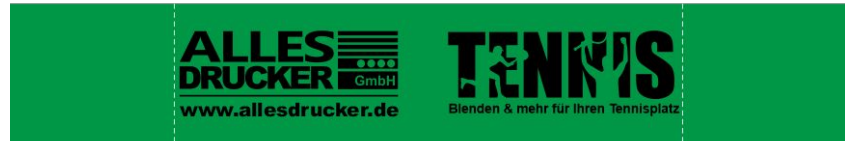
Druckgröße M (40-60%) - Maximale Druckbreite 720cm