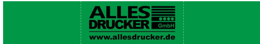
Druckgröße S (bis 40%) - Maximale Druckbreite 480cm