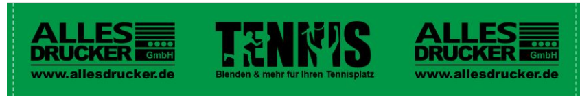
Druckgröße L (über 60%) - Maximale Druckbreite 1180cm

Produktionskostenbeispiel bei 12x2m, Druckflächengröße M - kleiner 40%, Fläche Blau, Schwarzer Druck, 2 Stück, netto inkl Versand: ca. 460 € .